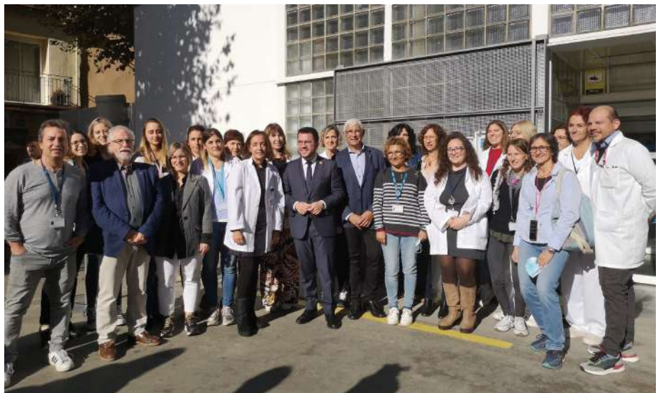
El president de la Generalitat i el conseller de Salut amb el personal del CAP d'Arbúcies