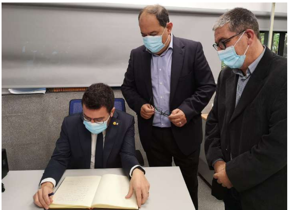
El president de la Generalitat firmant el llibre d'honor de l'Ajuntament

les unitats de salut bucodental permeti que aquestes adoptin models d'atenció més proactius pel que fa